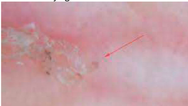
Midegang og mide i dermatoskop