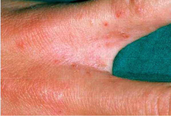
Fnat mellem fingre