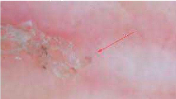
Midegang og mide i dermatoskop