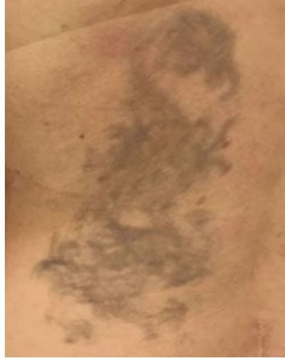
Før og efter 4 behandlinger